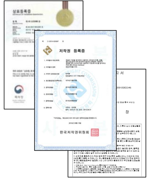
< 상표/저작권 등록 및 특허 출원 >